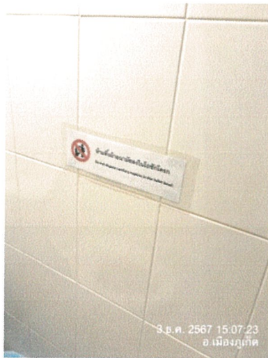
รูปภาพที่ 2.15 ป้ายห้ามทิ้งผ้าอนามัยลงในชักโครก