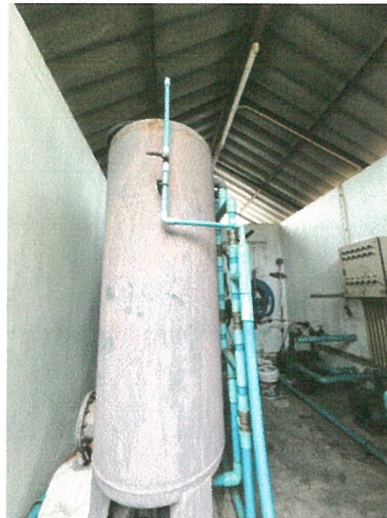
รูปภาพที่ 2.16 ระบบการส่งจ่ายน้ำ