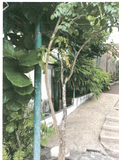
รูปภาพที่ 2.1 พื้นที่สีเขียว