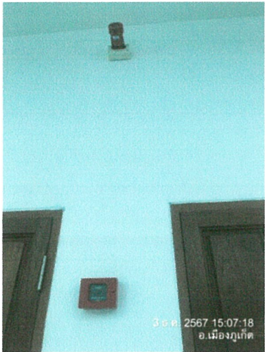
อุปกรณ์แจ้งเหตุด้วยมือ /ไซเรนเสียง