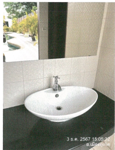
รูปภาพที่ 2.17 สุขภัณฑ์ประหยัน้ำ