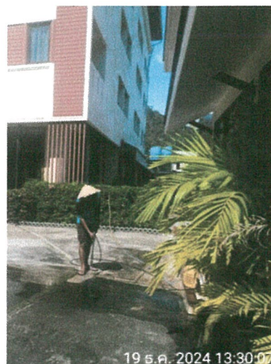
รูปภาพที่ 2.2 คนสวน