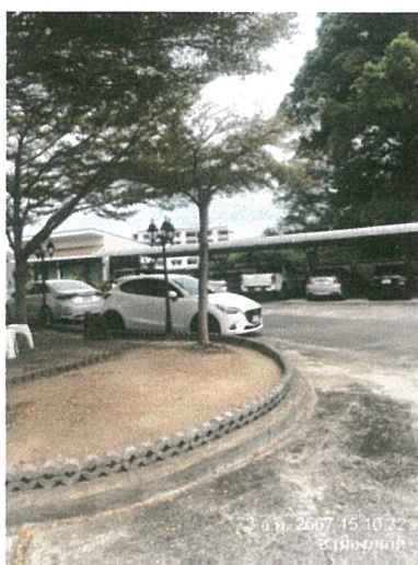
รูปภาพที่ 2.7 พื้นที่จอดรถ