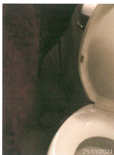
รูปภาพที่ 2.18 การตรวจสอบสุขภัณฑ์