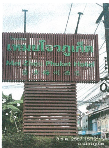
รูปภาพที่ 2.5 ป้ายโครงการ