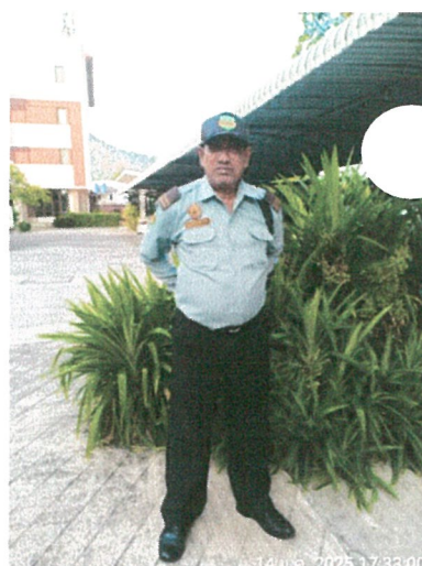
รูปภาพที่ 2.6 เจ้าหน้าที่รักษาความปลอดภัย