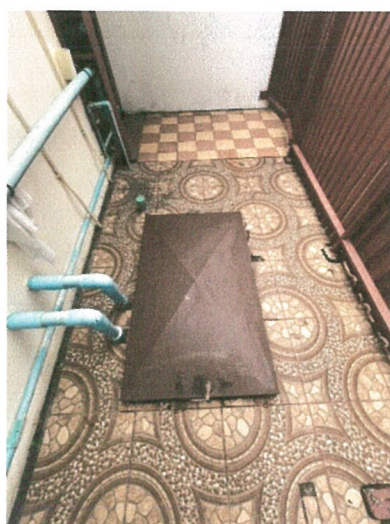
รูปภาพที่ 2.13 ถังเก็บน้ำ