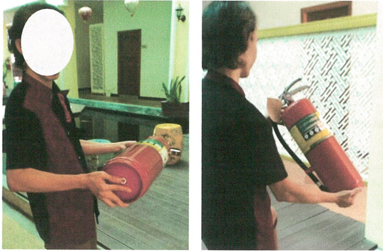
รูปภาพที่ 2.23 การตรวจสอบระบบป้องกันอัคคีภัยต่างๆ