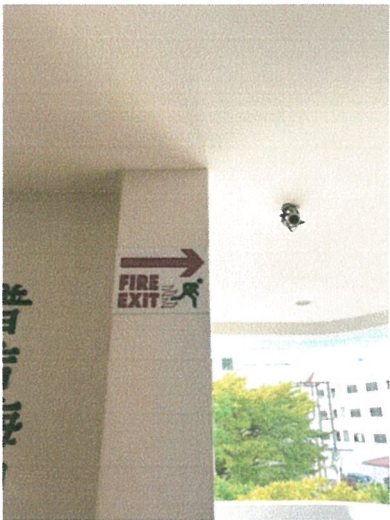
รูปภาพที่ 2.31 ป้ายแสดงตำแหน่งของห้องพักและป้ายทางหนีไฟ