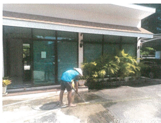
รูปภาพที่ 2.12 ทำความสะอาดพื้นที่โครงการ