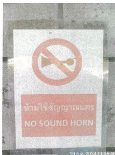
รูปภาพที่ 2.11 ป้ายห้ามใช้สัญญาณแตร