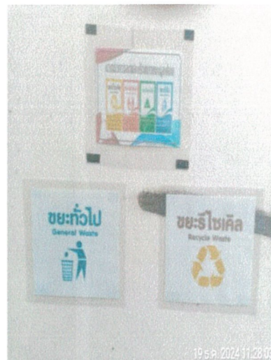
รูปภาพที่ 2.21 ป้ายรณรงค์คัดแยกขยะ