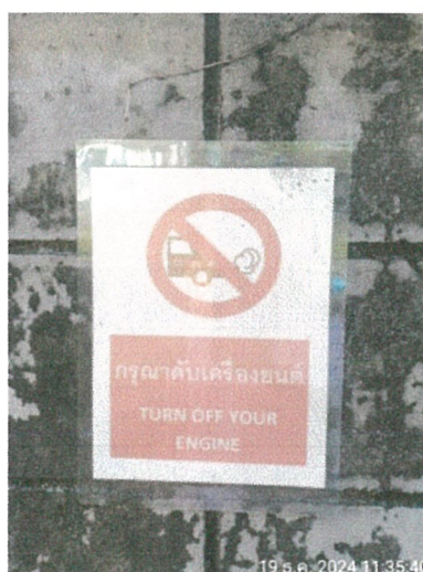
รูปภาพที่ 2.9 ป้ายกรุณาดับเครื่องยนต์