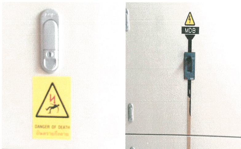
รูปภาพที่ 2.24 ป้ายเตือนอันตรายไฟฟ้าแรงสูง