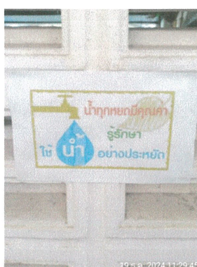
รูปภาพที่ 2.14 ป้ายรณรงค์และประชาสัมพันธ์ให้ประหยัดน้ำ