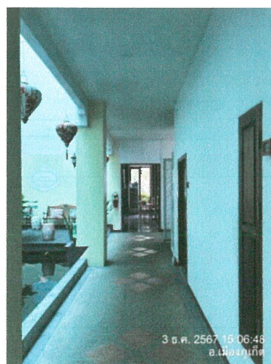
รูปภาพที่ 2.4 อาคารของโครงการ