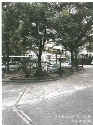
รูปภาพที่ 2.22 รางระบายน้ำ