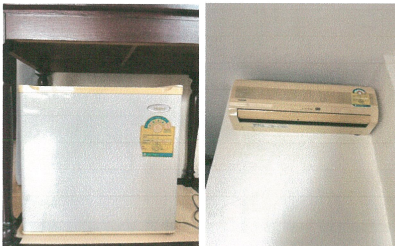
รูปภาพที่ 2.25 อุปกรณ์ไฟฟ้าประหยัพลังงาน