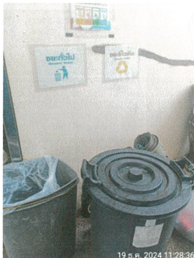
รูปภาพที่ 2.20 จุดคัดแยกขยะของโครงการ