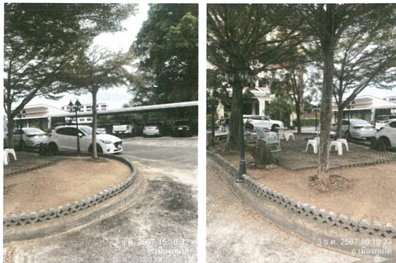
รูปภาพที่ 2.26 ไฟฟ้าส่องสว่าง