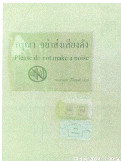
รูปภาพที่ 2.10 ป้ายกรุณาอย่าส่งเสียงดัง