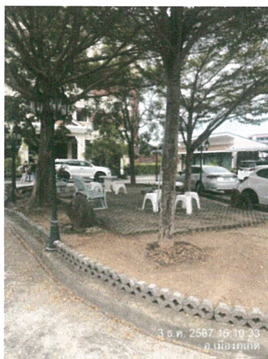
รูปภาพที่ 2.3 พื้นที่ของโครงการ