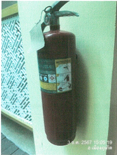
ถังดับเพลิง