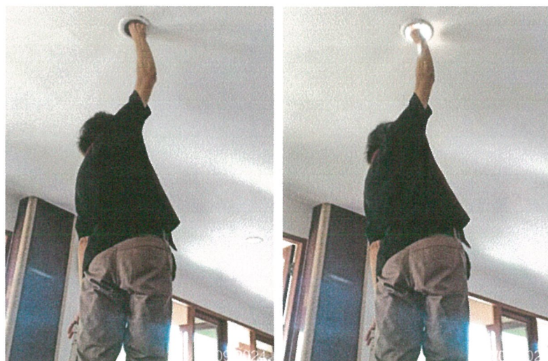
รูปภาพที่ 2.29 การตรวจสอบอุปกรณ์ไฟฟ้า