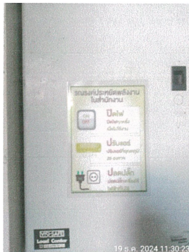
รูปภาพที่ 2.27 ป้ายรณรงค์ประหยัดไฟฟ้า