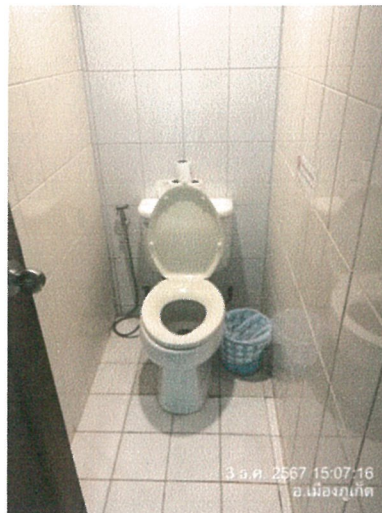
รูปภาพที่ 2.19 ถึงขยะภายในโครงการ