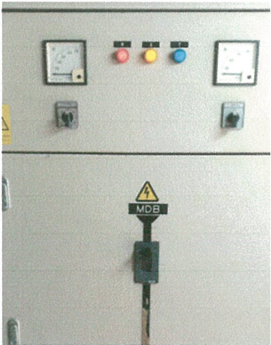
รูปภาพที่ 2.32 ตู้ควบคุมไฟฟ้า