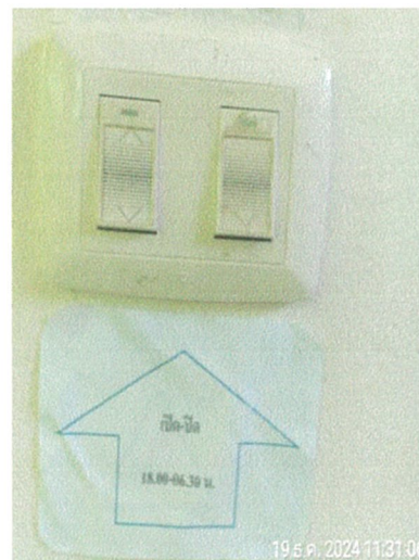
รูปภาพที่ 2.28 ป้ายบอกเวลาเปิด-ปิดไฟฟ้า