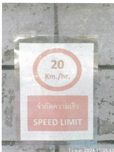
รูปภาพที่ 2.8 ป้ายจำกัดความเร็วไม่เกิน 20 กม./ชม.